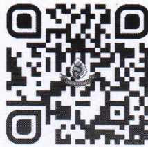
ลิงค์สมัคร

(๒) การชำระเงินค่าธรรมเนียมในการสมัครสอบ ตั้งแต่วันที่ ๓ พฤษภาคม ๒๕๖๖ และสิ้นสุดภายในเวลา ๒๔.๐๐ น. ของวันที่ ๑๒ พฤษภาคม ๒๕๖๖ ทั้งนี้ การรับสมัครสอบจะมีผลสมบูรณ์ เมื่อชำระค่าธรรมเนียมในการสมัครสอบเรียบร้อยแล้ว และได้ดำเนินการครบทุกขั้นตอนภายในวัน เวลา ที่กำหนด โดยผู้สมัครสอบสามารถชำระเงินได้ โดย ผู้สมัครสอบสามารถสแกน QR Code ชำระค่าลงทะเบียนผ่านแอปพลิเคชันของทุกธนาคาร และให้แนบหลักฐานยืนยันการชำระเงินได้ที่ https://bit.ly/3HBfQeO