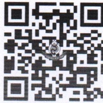
ลิงค์สมัคร

(๒) การชำระเงินค่าธรรมเนียมในการสมัครสอบ ตั้งแต่บัดนี้เป็นต้นไป และสิ้นสุดภายในเวลา ๒๔.๐๐ น. ของวันที่ ๓๑ ตุลาคม ๒๕๖๖ ทั้งนี้ การรับสมัครสอบจะมีผลสมบูรณ์ เมื่อชำระค่าธรรมเนียมในการสมัครสอบเรียบร้อยแล้ว และได้ดำเนินการครบทุกขั้นตอนภายในวัน เวลา ที่กำหนด โดยผู้สมัครสอบสามารถชำระเงินได้ โดย ผู้สมัครสอบสามารถสแกน QR Code ชำระค่าลงทะเบียนผ่านแอปพลิเคชันของทุกธนาคาร และให้แนบหลักฐานยืนยันการชำระเงินได้ที่ https://bit.ly/47SBHeo